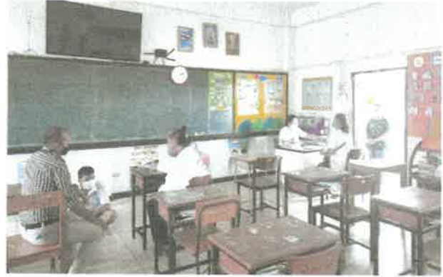
ชั้นมัธยมศึกษาปีที่ ๑/๒