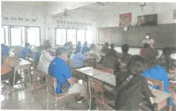
ชั้นมัธยมศึกษาปีที่ ๑/๓