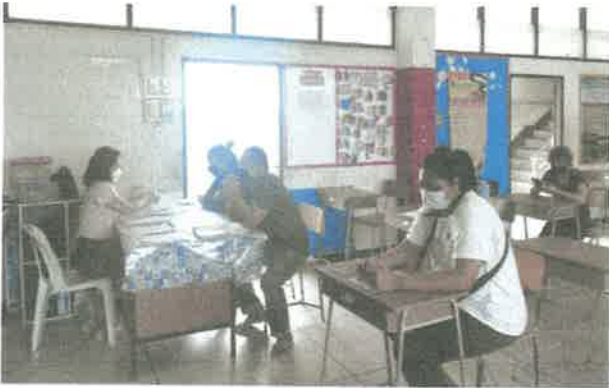
ชั้นมัธยมศึกษาปีที่ ๑/๑