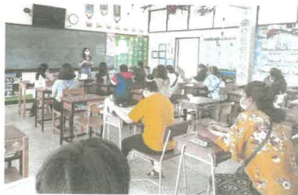
ชั้นมัธยมศึกษาปีที่ ๑/๕