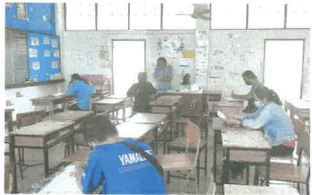
ชั้นมัธยมศึกษาปีที่ ๑/๔